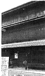
旧川本邸正面 3層楼閣の存在感は圧巻